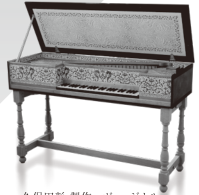
久保田彰 製作 ヴァージナル

当劇場オルガン事業アドバイザーの大塚直哉が、毎回多彩なゲストを迎えてお贈りする、バロック音楽の新たなシリーズが始まります。初回のゲストは、名画のなかに描かれた「料理」をリアルに再現したレシピなどで話題のキュレーター、林綾野。フェルメールと同じくオランダで活躍した作曲家で、今年没後400年を迎えるスウェーリンクの、タイトルさえも美しい音楽の数々を奏でるのは、劇場所有のチェンバロ(フォン・ナーゲル 製作)やポジティブオルガン(須藤宏 製作)に加え、本公演のために東京から持ち込まれる「ヴァージナル」(久保田彰 製作)。この楽器が描かれたフェルメールの絵画も投影しながら交わされる二人の「美味しい」芸術談義をお楽しみください。聴覚、視覚、味覚、それに匂いや手触りさえも…。五感のまじりあうところに立ちこめる馥郁たるアートの薫りで、人生により豊かな彩りを添えてみませんか?