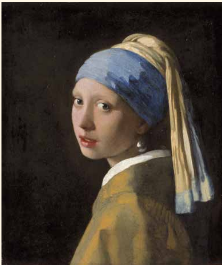
ヨハネス・フェルメール「真珠の耳飾の少女」(1665年頃) マウリッツハウス王立美術館蔵