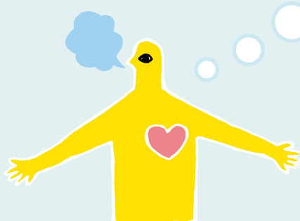
昨年の「アートな学び舎」の様子