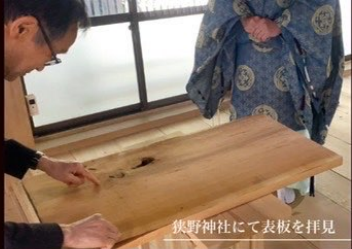
狭野神社にて表板を拝見

天孫降臨の地「みやぎざき」で生まれた御神木（災害などにより折れてしまった御神木）が、ヴァイオリンという新たな姿に生まれ変わり、これから何百年と祭事などを通して世界中の人々に魂の音色をお届けいたします。