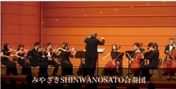
みやぎざき SHINWANOSATO 合奏団