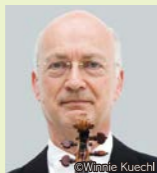
ヴァイオリン ライナー・キュッヒル