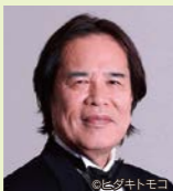
ヴァイオリン 徳永二男