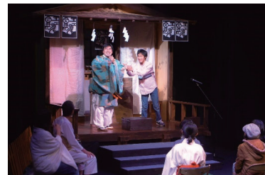
過去の「かどっこ」発表公演 作・演出 濱沙果宏