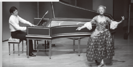
ひなたのバロック#3 クラヴサンのための音楽とロココの絵画