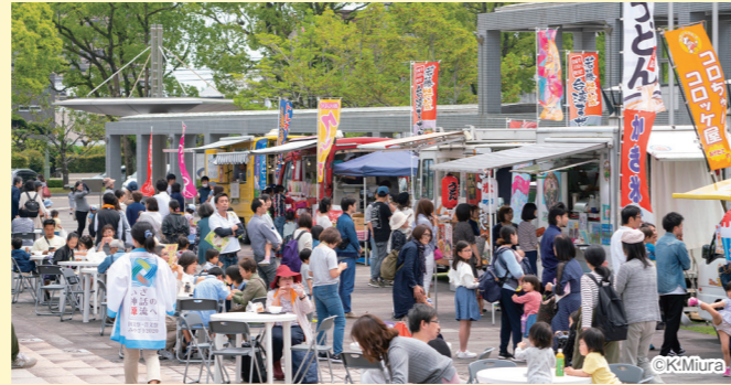
過去のフードブースの様子