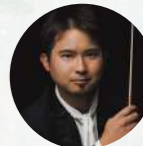
お話し:三浦文彰