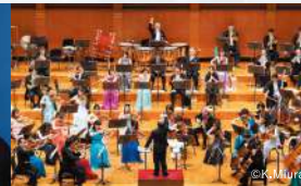
宮崎国際音楽祭管弦楽団