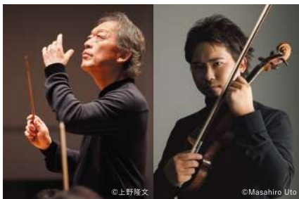
指揮 チョン・ミョンフン ヴァイオリン 三浦文彰

5.17(土) 開演15:00 指揮:チョン・ミョンフン ヴァイオリン:三浦文彰 宮崎国際音楽祭管弦楽団