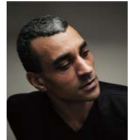
パトリック・ド・バナ

後編では、音楽祭の根底にある「室内楽」の魅力や、今回の音楽祭のために選り抜かれた名手たちについて、三浦音楽監督に伺っていきます。