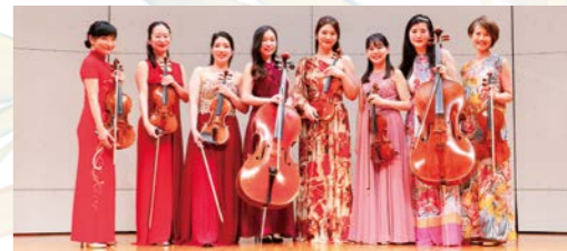
NADESHIKO 弦楽八重奏団 第30回メンバー