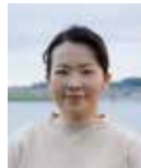
立山 ひろみ (たてやま・ひろみ) 劇作家、演出家 / 宮崎県立芸術劇場 演劇ディレクター