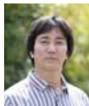
日高 啓介 (ひだか・けいすけ) 俳優